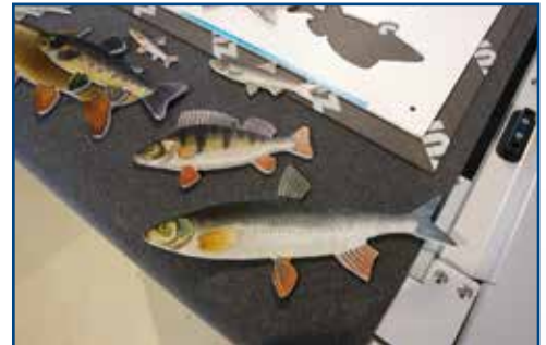
Bsp. für Konturschnitt: gefräste Formobjekte

Achtung: Bei Druckdateien ohne Anschnitt können wir nicht garantieren, dass an den Motivrändern keine weißen Blitzer entstehen. Cutkonturen in CMYK-Prozessfarben können nicht ausgeblendet und müssen mitgedruckt werden - eventuell sind sie an den Motivrändern zusehen. Sollten Sie Fragen zur Datenvorbereitung haben, können Sie jederzeit anrufen. Gern übernehmen wir auch kostenpflichtig die Aufbereitung ihrer Daten für den Konturschnitt.