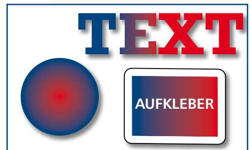
Bsp. für Konturschnitt: gedruckte und angestanzte Folien (Texte, Logos, Kreise, Aufkleber)